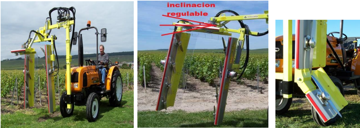
Imágenes referenciales pueden contener opcionales

Sus múltiples controles hidráulicos permiten definir posición de inclinación de la caja de corte especialmente útil para trabajo en lomajes. Además cuenta con extensiones angulares para poda de las "faldas" interiores de la espaldera.